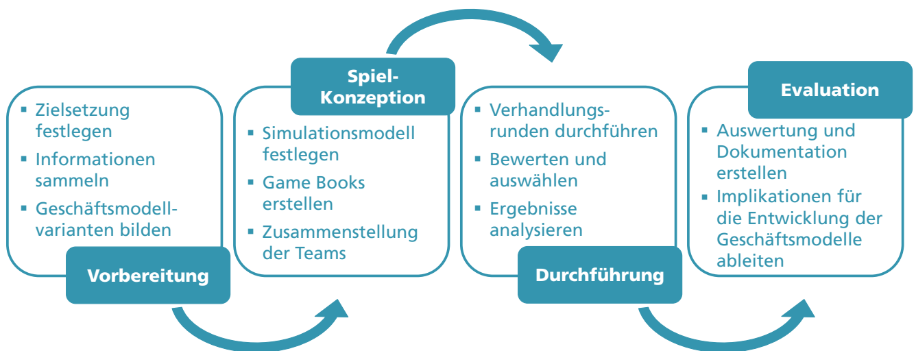
Abb. 2: Phasen und Aktivitäten in der Testphase mit dem Business Model Clash

hung, die Integration von IT-Partnern oder das Kosten- und Erlössystem). Aufgrund der wachsenden Komplexität und der Unsicherheit vieler Unternehmen bei der Entwicklung und Markteinführung der Smart-Service-Geschäftsmodelle sollten diese frühzeitig getestet werden. Mit dem »Business Model Clash« hat das Fraunhofer IAO dabei ein Simulationskonzept zum Testen neu entwickelter Geschäftsmodelle entwickelt.