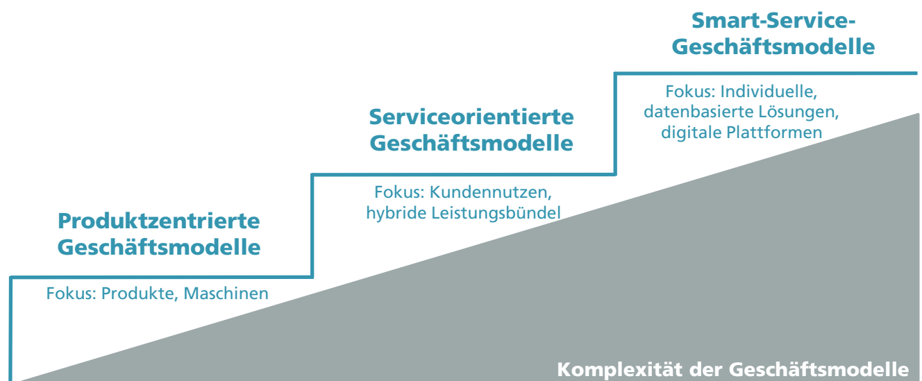
Abb. 1: Transformationsstufen von Geschäftsmodellen im produzierenden Gewerbe

Um die Potenziale der Digitalisierung nutzbar zu machen, ist die Weiterentwicklung von serviceorientierten Geschäftsmodellen zu Smart-Service-Geschäftsmodellen allerdings zwingend notwendig. Ein Beispiel dafür stellt zum Beispiel die Leistung des »Predictive Maintenance« dar, bei dem Anbieter Maschinendaten sammeln, auf einer digitalen Plattform zusammenführen und auswerten, um Potenziale zur Erhöhung von Qualität und Produktivität des technischen Services bei Reparatur- und Wartungsarbeiten auszuschöpfen (vgl. Tombeil/Neuhüttler/Ganz, 2016). Neben der Bereitstellung individueller Lösungen steht die verlässliche Datenauswertung über Algorithmen sowie die digitale Plattform im Mittelpunkt des Geschäftsmodells, was wiederum Auswirkungen auf andere Bereiche des Geschäftsmodells hat (zum Beispiel Kundenbezie-